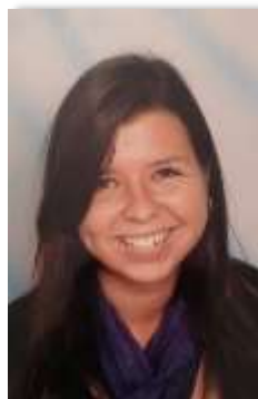
Schulfoto aus dem Jahr 2014